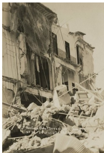
Santiago de Cuba después del terremoto de 1932