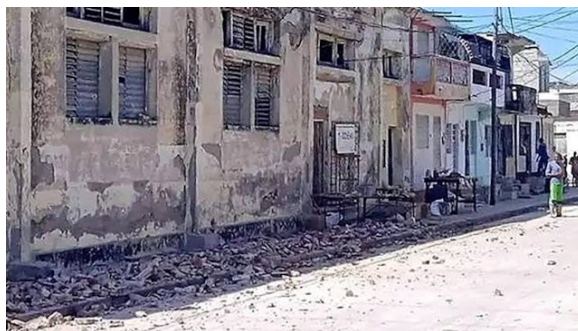
El pretil de la antigua panadería El Fénix, en la calle General Benítez, no aguantó la sacudida y se vino abajo.

A las 10:50 am del lunes 10 de noviembre de 2024, se reportó un terremoto de magnitud 6.0 a 48 kilómetros al sureste de Pilon. Además de todos los territorios granmenses, hubo reportes de perceptibilidad en las provincias de Santiago de Cuba, Guantánamo y Holguín. Casi una hora después, a las 11.49 am, la tierra se volvió a estremecer pero ahora con una fuerza de 6.7 y mucho más cerca, a solo 32 km del mismo sitio. Los daños más notables se reportaron en Pilon; aunque en otras localidades como Manzanillo y Bartolomé Masó hubo agrietamientos de edificaciones y deslizamientos de tierra. No se reportaron víctimas fatales.